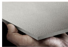
[TEXTURA] 20 teintes