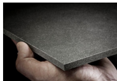
[NATURA PRO] 27 teintes