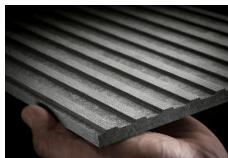
[LINEA] 4 teintes