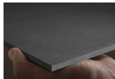
[TECTIVA] 9 teintes

Les panneaux EQUITONE sont des panneaux de façade décoratifs sont issus de matières premières naturelles (ciment, eau, fibres de bois, fibres textiles). Les produits EQUITONE sont reconnus pour leur respect de l'environnement, leur durabilité, leur résistance aux intempéries et le peu d'entretien qu'ils nécessitent. Disponibles dans 6 finitions différentes et teintés dans la masse, les panneaux abordent des aspects naturels développés pour l'habillage architectural des façades.