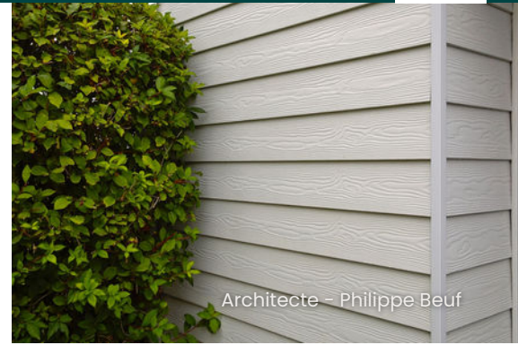
Architecte - Philippe Beuf