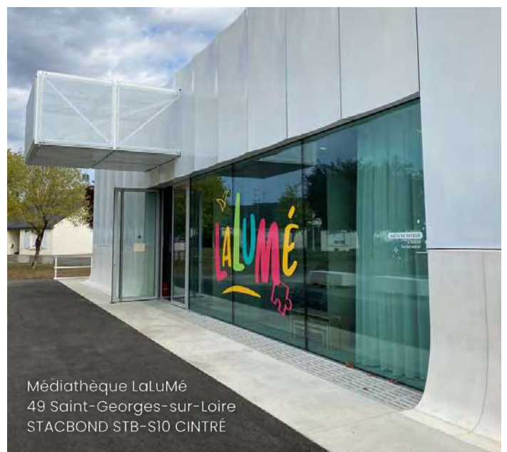
Médiathèque LaLuMé 49 Saint-Georges-sur-Loire STACBOND STB-S10 CINTRÉ