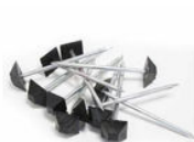
POINTES SPÉCIALES 70MM - SACHET DE 100 POINTES